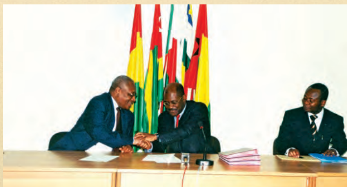
Signature Convention ACBF - AFRISTAT