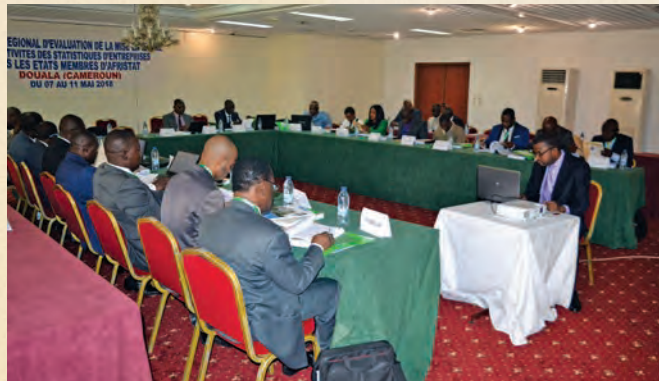
Séminaire sur les statistiques d'entreprises Douala, 7-11 mai 2018