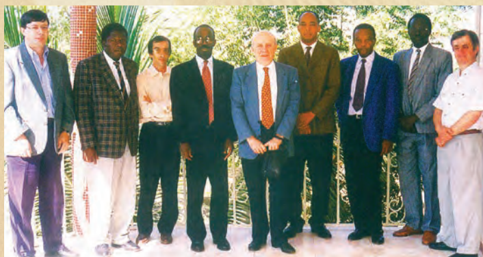
Les participants à la 1 re réunion du Conseil scientifique Bamako, 6-7 janvier 1997