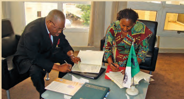
Signature Accord AFRISTAT - BAD