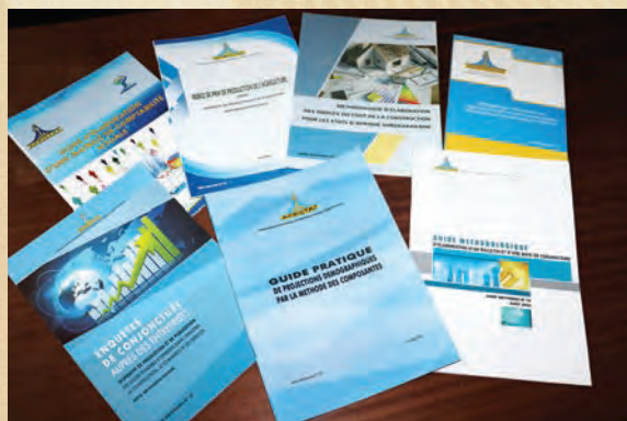
Publication des documents méthodologiques