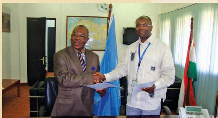
Signature Convention AFRISTAT - CEA/BSR-AO