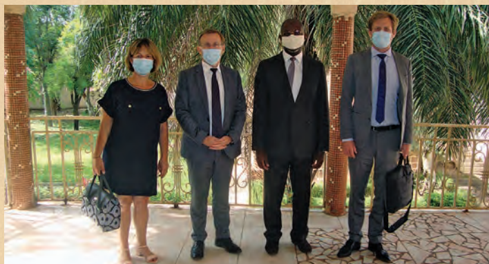
Partenariat AFRISTAT - Expertise France