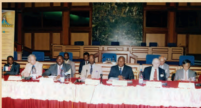
13 e réunion du Comité de direction Libreville, avril 2006 10 e Anniversaire d'AFRISTAT