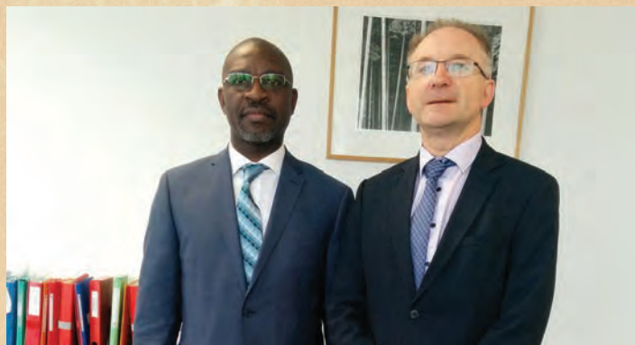
Partenariat AFRISTAT - INSEE