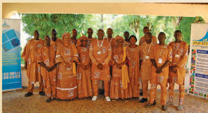
Le Personnel en 2021