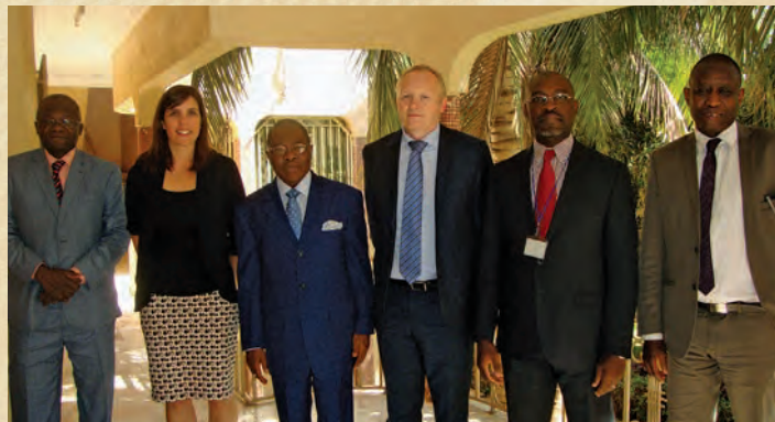
Partenariat AFRISTAT - FAO