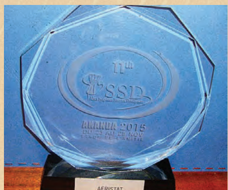
AFRISTAT a été primé pour sa contribution en faveur du développement de la statistique lors du 11 e symposium de l'ASSD, tenu à Libreville en novembre 2015