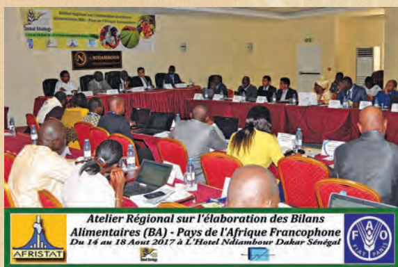
Atelier de formation BA à Dakar, 14-18 avril 2017