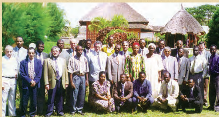
Les participants à la 3 e réunion du Comité de direction Bamako, 10-13 novembre 1997