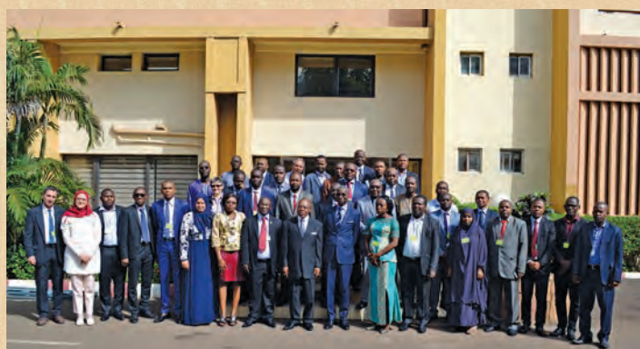
Participants au séminaire ERETES à Bamako en 2017