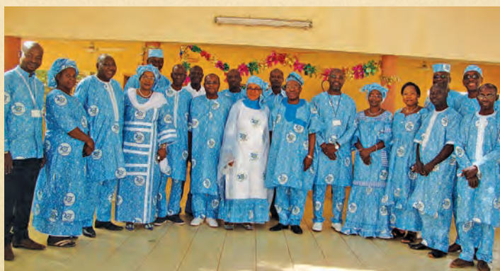
Le Personnel en 2016