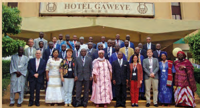
34 e réunion du Comité de direction Niamey, septembre 2016 20 e Anniversaire d'AFRISTAT