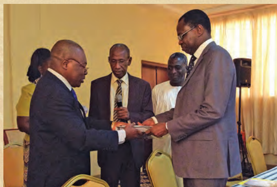
Remise du logiciel Phoenix UEMOA