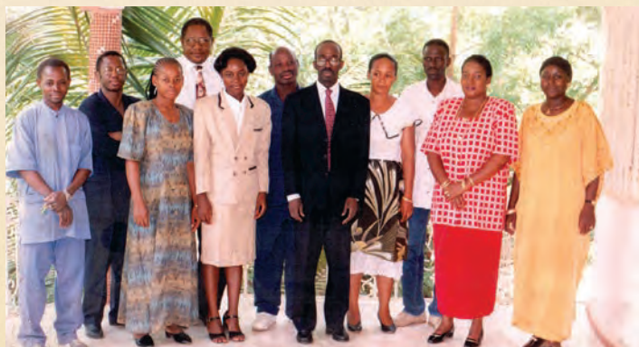
Le Personnel en 1998