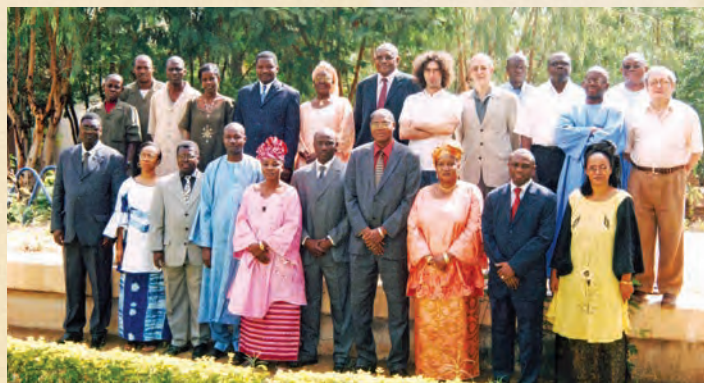
Le Personnel en 2006