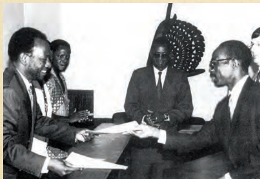
Signature de l'Accord de siège entre le Gouvernement de la République du Mali et AFRISTAT le 15 octobre 1996 à Bamako