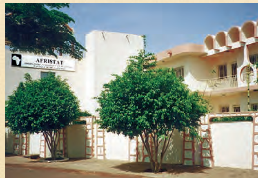
Siège d'AFRISTAT depuis le 4 avril 1996 à ce jour