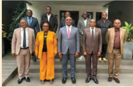
Participants de l'atelier de Libreville

Après le Congo et le Tchad en fin d'année 2025, le tour est revenu au Gabon et à la Guinée Equatoriale ce premier trimestre 2026. Dans ces deux pays les acteurs du système statistique avaient