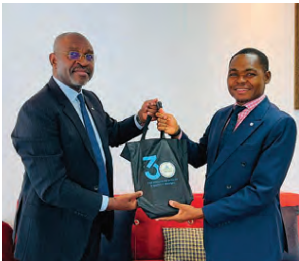
Remise du pack des 30 ans d'AFRISTAT au Directeur Général de l'INEGE