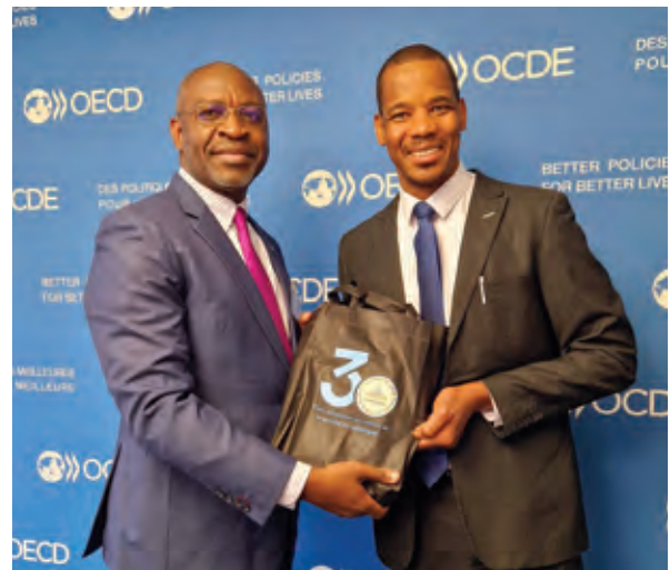
Remise du pack des 30 ans d'AFRISTAT au Chef Adjoint de l'Unité Afrique du Centre de Développement de l'OCDE