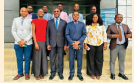
Participants à l'atelier de Malabo

déjà été initiés en 2023 à la démarche qualité et à l'auto évaluation de la conformité des pratiques nationales aux normes internationales en matière de qualité en statistique. Les missions qui se sont déroulées à Libreville du 13 au 25 janvier 2026