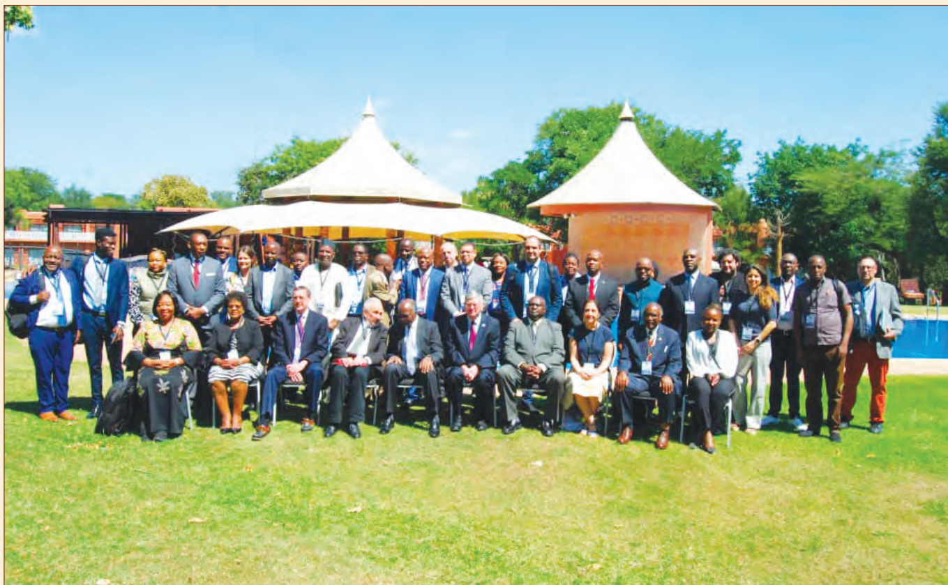
Les participants à la 17 ème conférence de l'IAOS à Livingstone