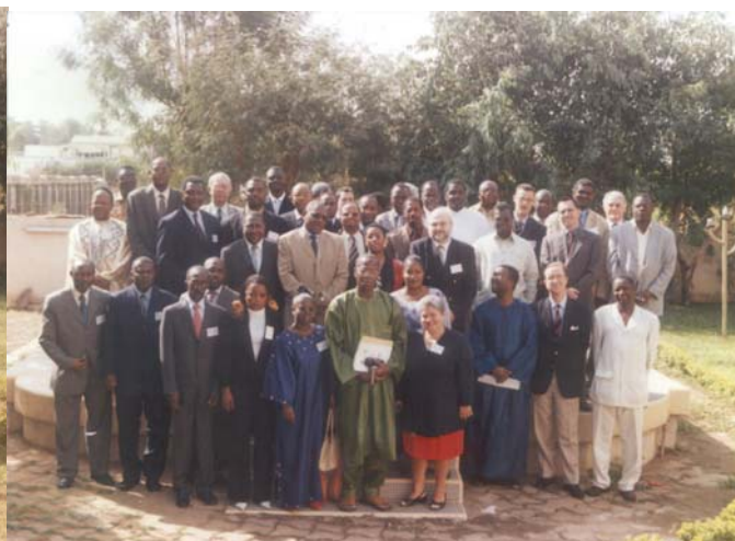
Séminaire Afrique Centrale