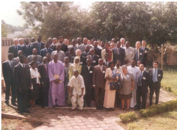
Séminaire Afrique de l'Ouest

www.paris21.org/pages/regional-programs/region/events/ .