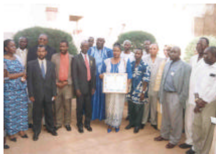
Photo de famille lors de la cérémonie de décoration